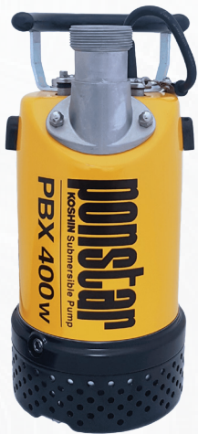
KOSHIN Ponstar PBX pumpe 2" Art.nr: PON 55022 PBX

Driftsikker 1-fas lensepumpe, konstruert for pumping av slamvann.