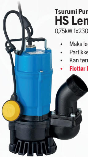
Tsurumi Pump HS Lensepumpe 0,75kW 1x230V/50Hz, 10m kabel