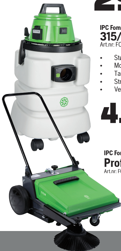
IPC Foma TK 510 M Proff feiemaskin Art.nr: FOMA SWEEP