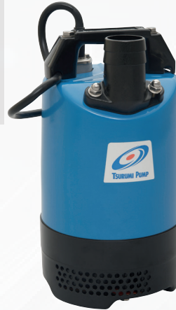
Tsurumi Pump LB-800-52 Lensepumpe Art.nr: TSU LB-800-52

Kompakt, lett og kraftfull lensepumpe for entreprenørbruk 0,75kW 1x230V/50Hz, 10m kabel