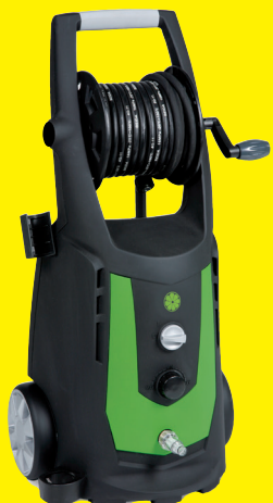
IPC Foma PW-C23 I1408A M Puss 140 bar, 7,6 l/min, 230V 10A 1-fas Art.nr: FOMA PW C 23 I 1408 A M PLUS

Leveres med: 12 meter h.t.slange, vaskelanse m/kombidyse, lanse m/tubodyse, vannkobling m/vannfilter og rensenål. Integrert såpetank (2 stk)