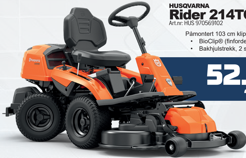
HUSQVARNA Rider 214TC - Comfort edition Art.nr: HUS 970569102