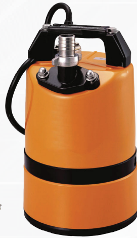
Tsurumi Pump LSC1.4S-51 Lensepumpe Art.nr: TSU LSC1.4S-51

LSC fjerner vann helt ned til 1mm. "Millimeterpumpen" 0,45kW 1x230V/50Hz, 10m kabel