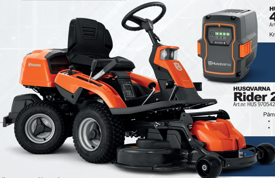
HUSQVARNA Rider 216TAWD Art.nr: HUS 970542401 K 103