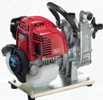
Honda 2" WX10 Pumpe Art.nr: WX 10 E2

Liten og lett 1" pumpe utstyrt med miljøvennlig Micro 4-takts motor.