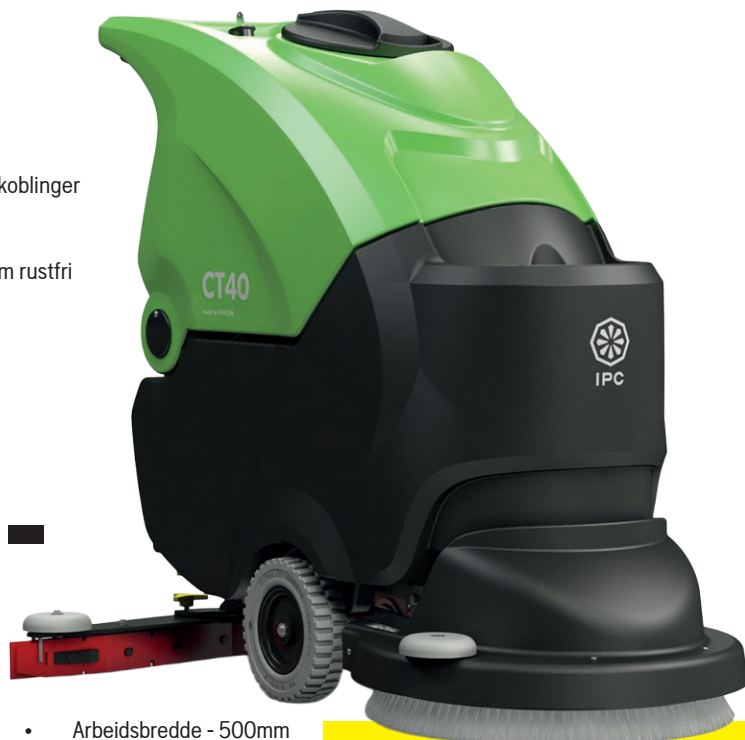
IPC Foma Gulvvaskemaskin CT40 B50 Art.nr: FOMA CT 40 B 50